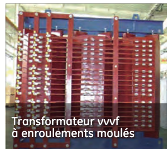
Transformateur vvvf à enroulements moulés

Même si les transformateurs secs en résine moulée standard peuvent répondre aux besoins de la plupart des applications, des modèles spéciaux peuvent être développés pour les transformateurs simple phase, les transformateurs de séparation, les transformateurs redresseurs, les transformateurs de mise à la terre et les transformateurs dotés de prises spéciales.