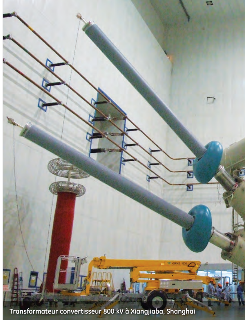
Transformateur convertisseur 800 kV à Xiangjiaba, Shanghai