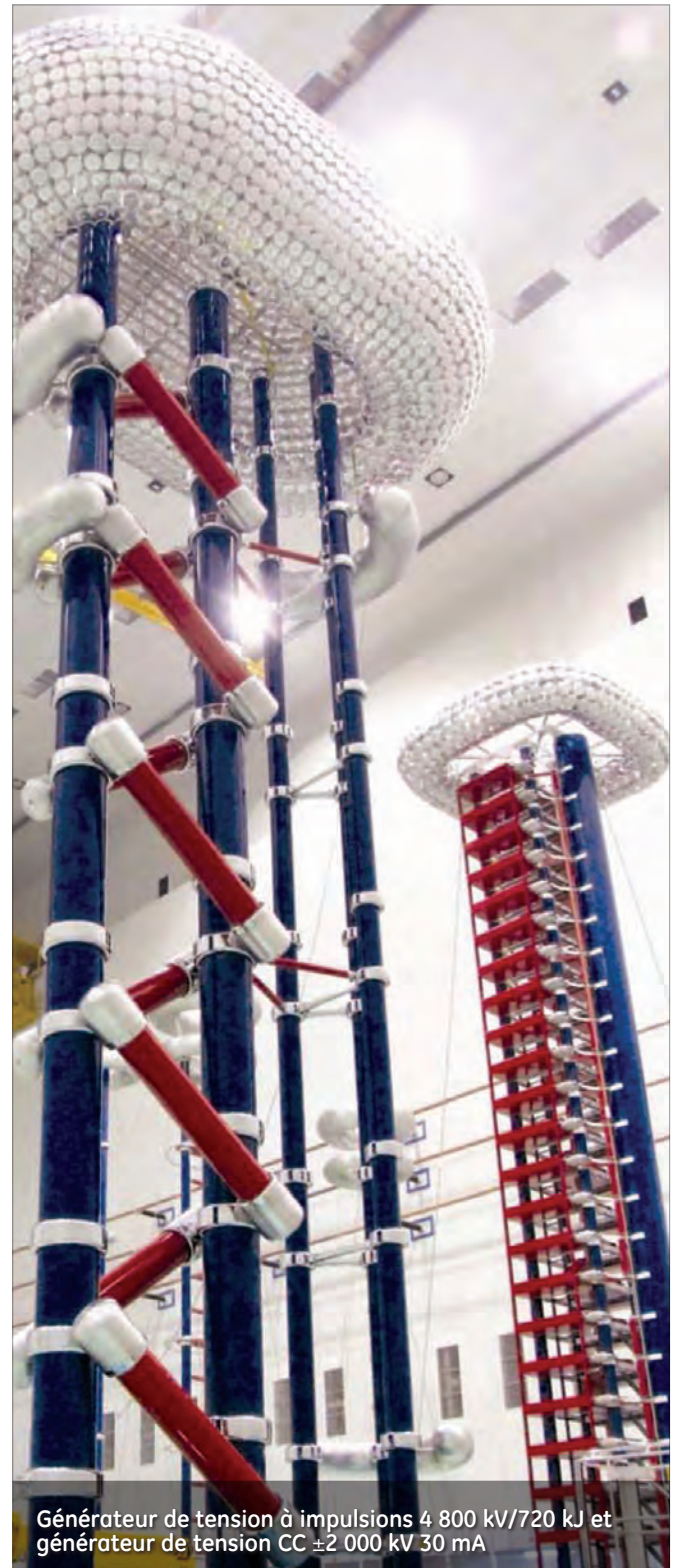
Générateur de tension à impulsions 4 800 kV/720 kJ et générateur de tension CC \pm 2\ 000 kV 30 mA