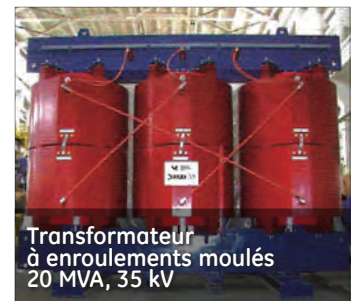
Transformateur à enroulements moulés 20 MVA, 35 kV