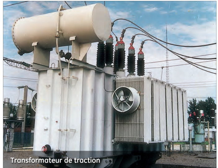
Transformateur de traction