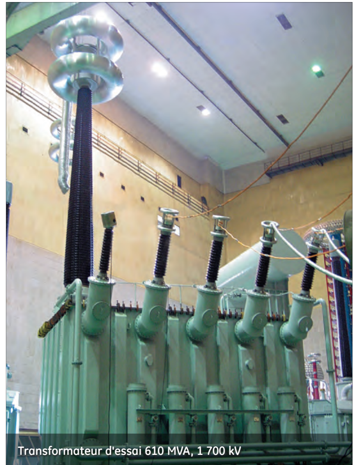
Transformateur d'essai 610 MVA, 1 700 kV

Les bobines d'inductance sont au cœur du portefeuille de produits de XD|GE, avec plus de 600 unités installées, à 500 kV ou plus, aux quatre coins du globe. Dans le cadre de la politique d'amélioration continue des produits de XD|GE, des études approfondies ont été menées sur les bobines d'inductance shunt afin d'améliorer leur conception fondamentale. Ces améliorations ont permis de réduire les pertes totales à moins de 100 kW, réduisant ainsi considérablement les surchauffes partielles. En outre, les émissions sonores et les vibrations ont également été réduites, pour plus de fiabilité.