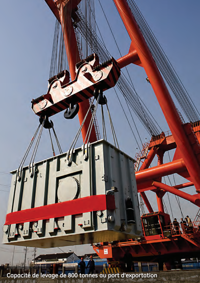
Capacité de levage de 800 tonnes au port d'exportation