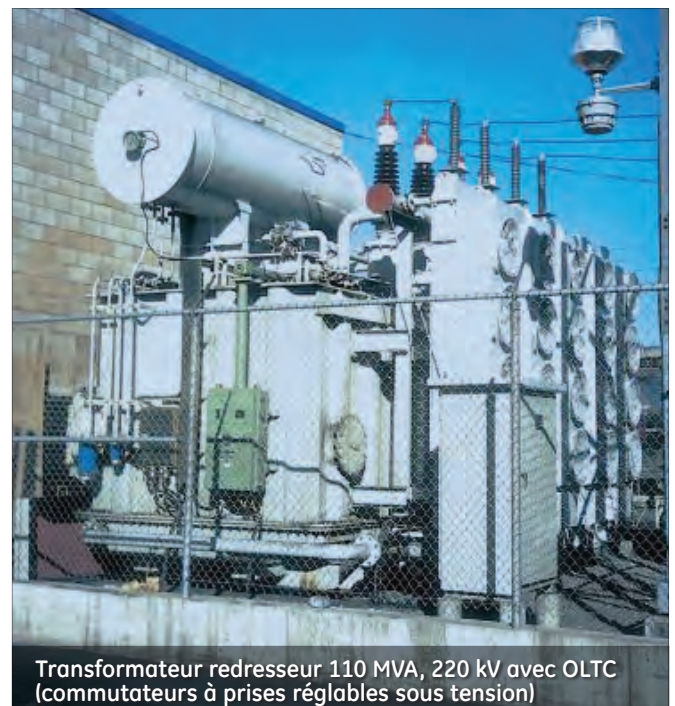
Transformateur redresseur 110 MVA, 220 kV avec OLTC (commutateurs à prises réglables sous tension)