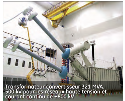
Transformateur convertisseur 321 MVA, 500 kV pour les réseaux haute tension et courant continu de \pm 800 kV