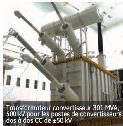
Transformateur convertisseur 301 MVA, 500 kV pour les postes de convertisseurs dos à dos CC de \pm 50 kV