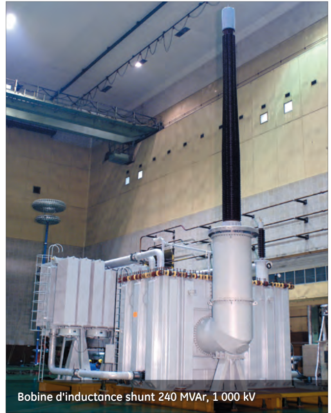
Bobine d'inductance shunt 240 MVAR, 1 000 kV