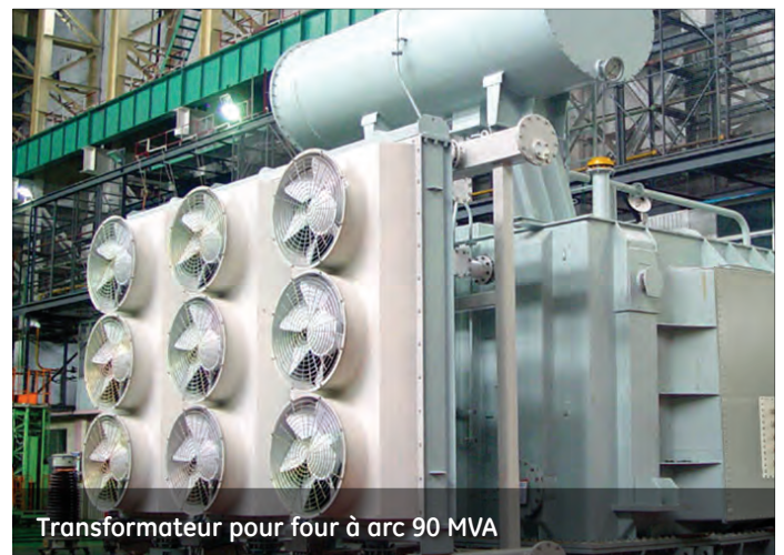
Transformateur pour four à arc 90 MVA

XD|GE a mis au point une technologie de pointe pour produire une gamme de transformateurs pour fours à arc, incluant transformateurs pour fours de fonderie à arc, transformateurs pour fours à affinage en poche et transformateurs pour les grands fours à arc destinés au traitement des minerais. Les transformateurs pour fours à arc de XD|GE sont disponibles en versions CA et CC, avec des capacités allant jusqu'à 200 MVA en version mono-cœur 35 kV, jusqu'à 160 MVA avec régulation de tension en série et jusqu'à 100 MVA avec une tension primaire de 110 kV.